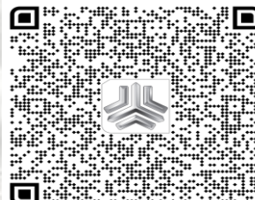
بارکد خودروی پادرا پلاس دو کابین ( کارون )