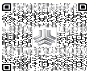
بارکد خودروی نیسان دوگانه سوز SVDH