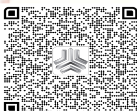
بارکد خودروی نیسان دوگانه سوز SVPDH